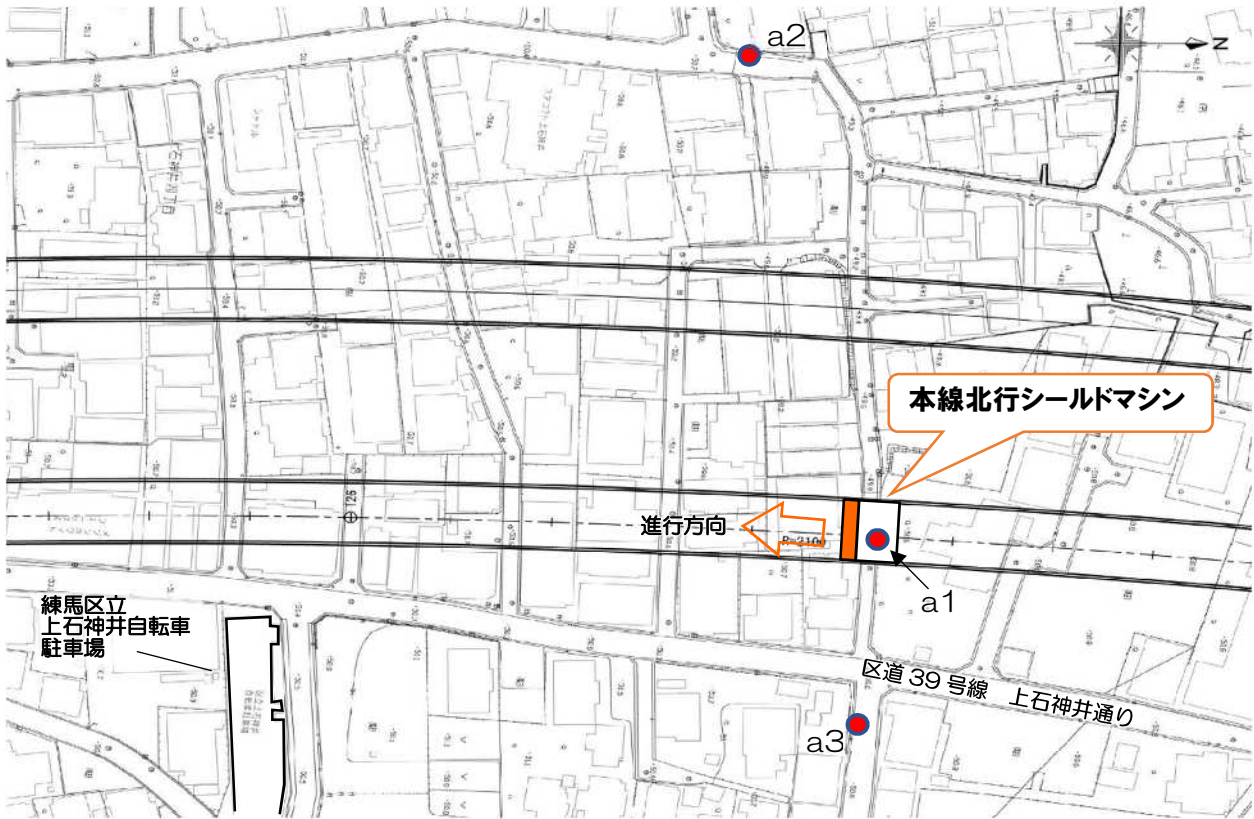
【9月20日（金） 8：00～22：00 振動・騒音計測結果（確定値）】